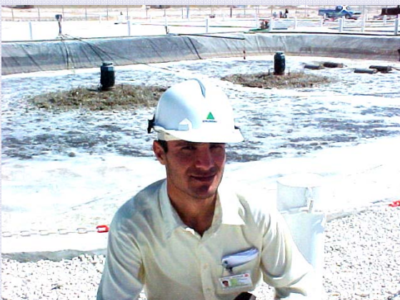
Base vie Hyundai / Iran Station d'Épuration des Eaux Usées

De nombreuses références, dans de nombreux pays, font de SFILS un interlocuteur privilégié pour vos projets à l'export.