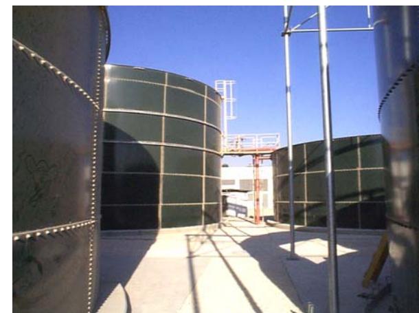
Station de Traitement en Acier Vitrifié