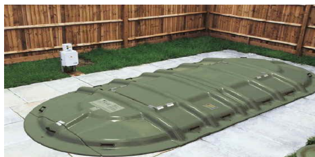
Station de Traitement des Eaux Usées par Biodisques