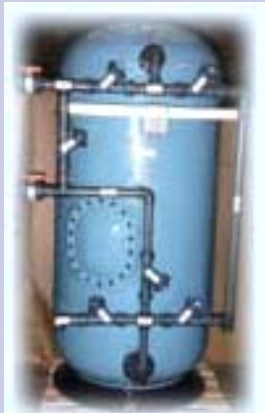
Filtre à Sable