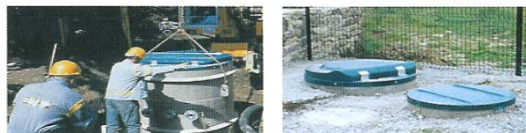
Réseau d'Assainissement Pose de stations de pompage préfabriquées